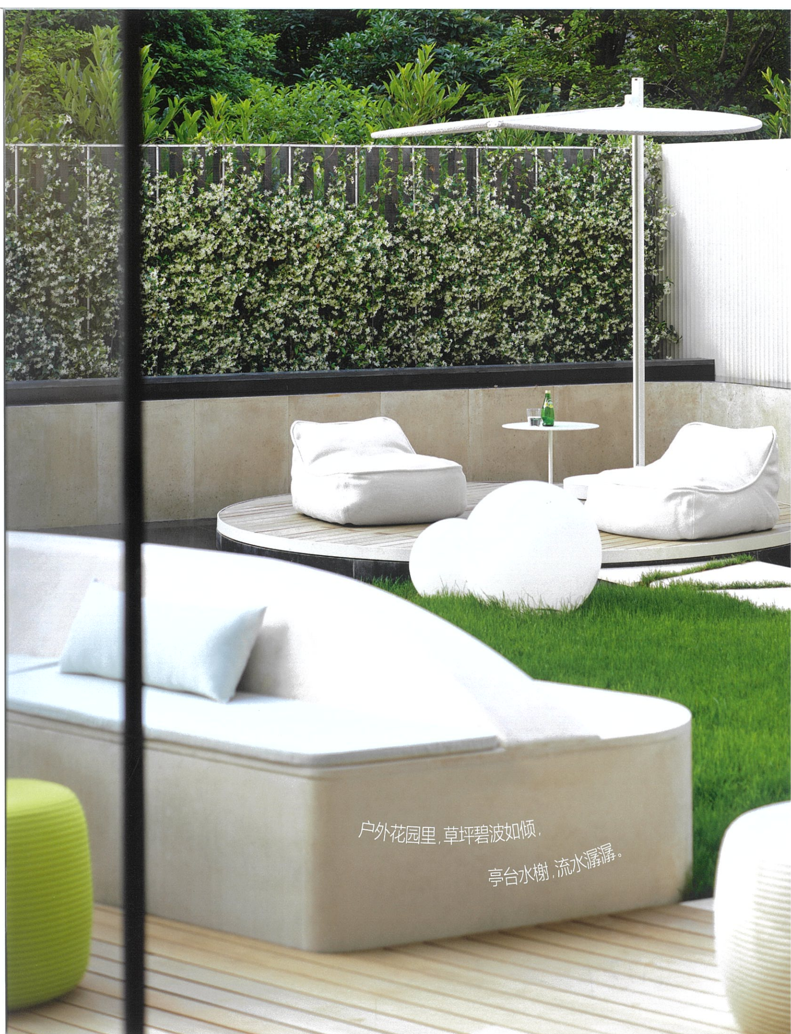
户外花园里, 草坪碧波如倾, 亭台水榭, 流水潺潺。